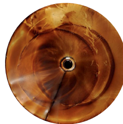
Mineralisches Hydrauliköl nach ISO VG 46 nach 1.000 Stunden (Ablagerungen begannen nach 500 Stunden)