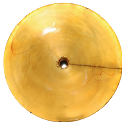
Mobil SHC Cibus™ 46 nach 1.250 Stunden

Die Hochleistungsschmierstoffe der Mobil SHC Cibus™ Reihe sind verglichen mit Standard-Umlaufölen langlebiger und halten Ihre wertvollen Anlagen länger sauber. Tests auf unserem MHFD-Prüfstand (Mobil Hydraulic Fluid Durability) belegen, dass es im Vergleich zu Mineralölen gleicher ISO VG (46) zu deutlich weniger Ablagerungen kommt.